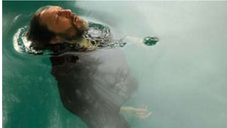
L'écart de Franz Josef Holzer

Ce festival de documentaires qui aura lieu du 16 au 25 mars a sélectionné Mission chez Tito réalisé par André Künzi et